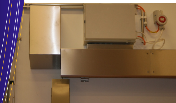
Motor, tandrem og køreskinne helt skjult