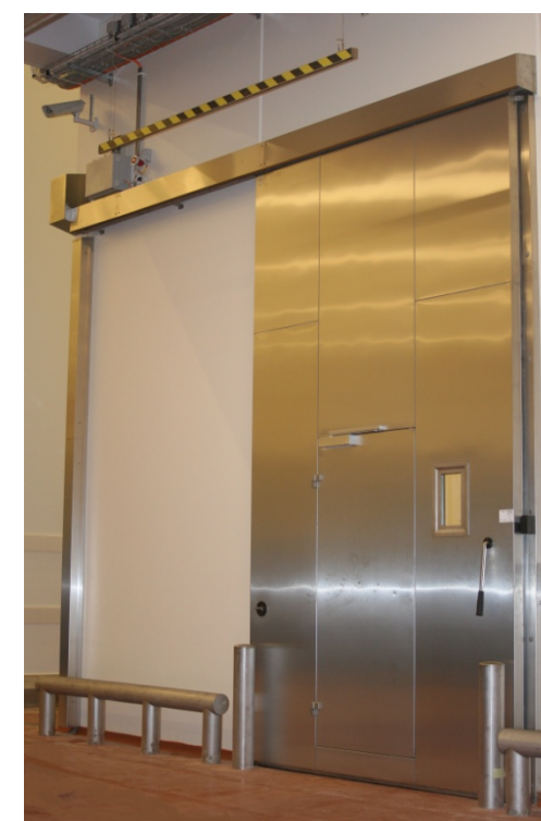
Kølerumsdør som brandport

"Udfordringen er at finde holdbare løsninger, der både er bedre for kunden, men også helst for vores produktion – for hvis der skal ændres noget for