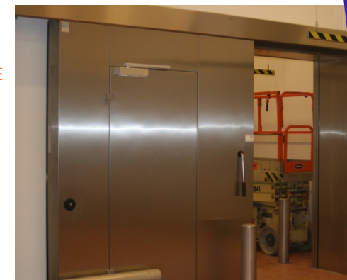
Nøddøre er indfældet i plan med forpladen

Den korte vej fra ide til færdig løsning gør Door System til en fleksibel partner, når vores kunder kommer med konstruktive ideer!