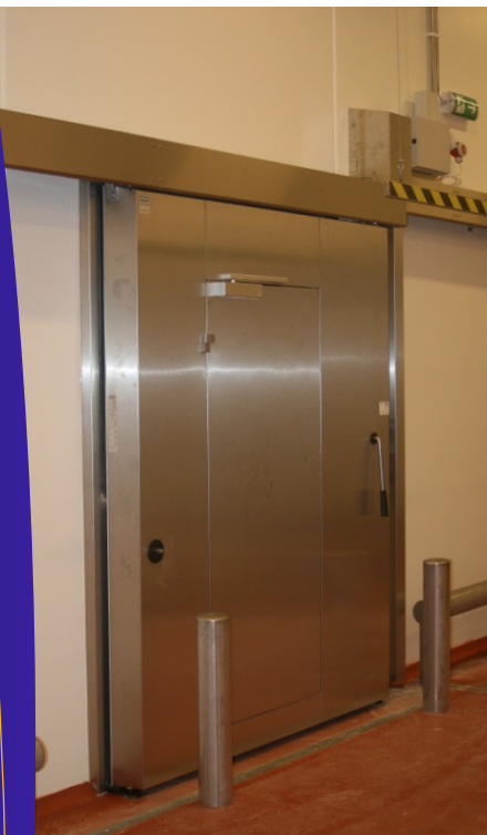
Køreskinne og tandrem er skjult.