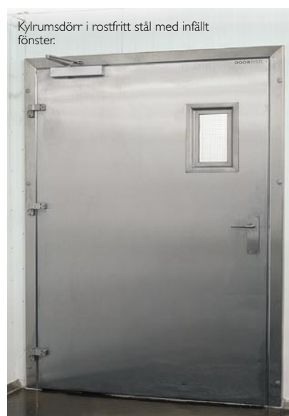
Kylrumsdörr i rostfritt stål med infällt fönster.

Våra dörrar utformas för infällning och delvis infällning i karm. Som standard tillverkas Door Systems karm i rostfritt stål. Vi anpassar karm och motkarm efter dina önskemål och behov så att du får en stor flexibilitet i miljön runt dörren. Dörrarna tätas med en silikongummi som är lämplig för alla typer av verksamheter; men speciellt för livsmedelsindustrin eftersom den varken avger, lukter, smak- eller giftämnen.