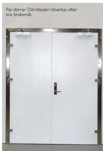
Par dörrar: Dörrbladen tillverkas efter era önskemål.